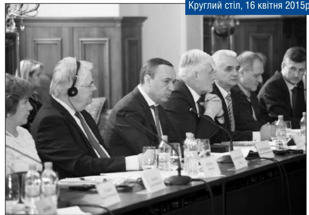
Круглий стіл, 16 квітня 2015р.

Одним із головних чинників негативного ставлення і низького рівня довіри до міліції є катування затриманих в органах внутрішніх справ. Насильство, на жаль, є масовим і систематичним. Хочу нагадати про результати досліджень, які наша організація – Харківська правозахисна група – проводила спільно з Інститутом соціальних досліджень у Харкові. У 2004р. було встановлено,