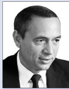
Микола МАРТИНЕНКО, народний депутат України, голова Ради Центру Разумкова

Тема нашої дискусії – надзвичайно актуальна для нинішньої ситуації в Україні. Реформа вітчизняної правоохоронної системи є одним з найбільш важливих і пріоритетних напрямів загальнонаціональних реформ. Її необхідність визнається всіма зацікавленими сторонами – громадянами, політиками, самими правоохоронцями.