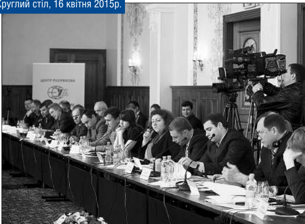
Круглий стіл, 16 квітня 2015р.

Координації всередині МВС теж немає. Наш пілотний проєкт у Львові не був цікавим для МВС. Це робили громадські активісти. Ті експерти, яких ми знайшли, – це представники середньої ланки міліції (як, до речі, говорилося, що реформи треба починати знизу) і які ввійшли до Координаційної ради Національної платформи, – вони мають конкретні пропозиції, які, думаю, будуть втілені з часом.