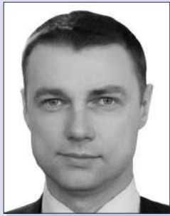
Віталій КУПРІЙ, заступник Голови Комітету Верховної Ради України з питань законодавчої забезпечення правоохоронної діяльності

По-перше , хочу роз'яснити присутнім, що відбувається зараз. Оскільки ми, депутати, ще з грудня 2014р. не бачили жодних законопроектів ні від Уряду, ні від Президента стосовно реформування міліції, створення державного бюро розслідувань тощо, ми почали самостійно рухатися вперед і висувати від себе, із залученням громадськості, ці законопроекти.