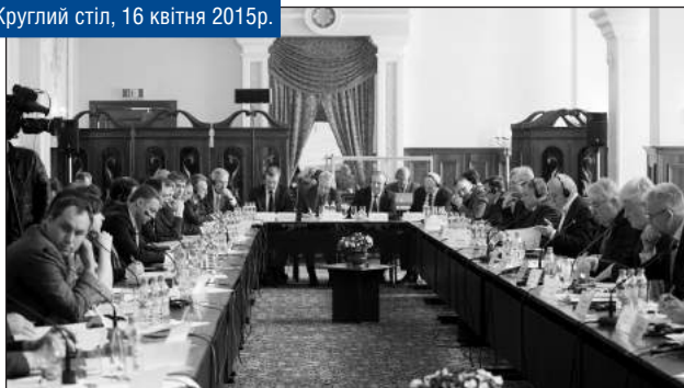
Круглый стіл, 16 квітня 2015р.

У нас уже несколько лет обсуждается проект электронной документации, подписи и т.д. Если бы этот подход (который, конечно, требует значительных финансовых ресурсов) был внедрён в МВД, то мы бы получили сокращение на две трети бюрократических процедур и сотрудников, что важно с точки зрения финансирования МВД. Сам электронный документооборот не только эффективно строит работу, но и вносит антикоррупционную составляющую, потому что очень легко отследить, кто заходил в систему, работал с документом, внёс правки, это не бумажка, которую можно вычеркнуть и подправить. Но всё это только предстоит делать. Поэтому призываю и доноров, и разработчиков реформ не упускать из внимания именно этот компонент. ■