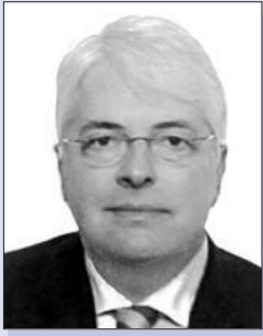
Кейс КЛОМПЕНХАУВЕР, Надзвичайний і Повноважний Посол Королівства Нідерландів в Україні

Дякую за можливість вітати всіх на Круглому столі, присвяченому реформі правоохоронних органів України. Реформа правоохоронних органів є важливим викликом для будь-якої країни і для будь-якого уряду – чи то Нідерландів, чи України, чи США. Ніколи це завдання не було легким. Не буду витратити час на аргументи про необхідність реформ в Україні, чи на повторення даних соціопитувань стосовно довіри громадян до правоохоронних органів. Вам це відомо краще, ніж мені. Україна сьогодні перебуває в унікальному становищі, коли Президент, Уряд і Верховна Рада демонструють політичну волю до реформування правоохоронних органів. Такі наміри підтримуються громадянським суспільством, яке чинить певний тиск на владу, і підкріплені широкою міжнародною підтримкою. І це є хорошою новиною.