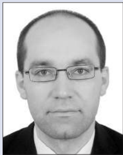
Мартін ЛІНХАРТ, радник з питань реформування сектору безпеки Офісу зв'язку НАТО в Україні

Я працюю в Україні лише вісім місяців і не можу сказати, що вже знайомий з усіма проблемами. Хочу зупинитися лише на двох питаннях, які мене турбують, – це координація і комунікація.